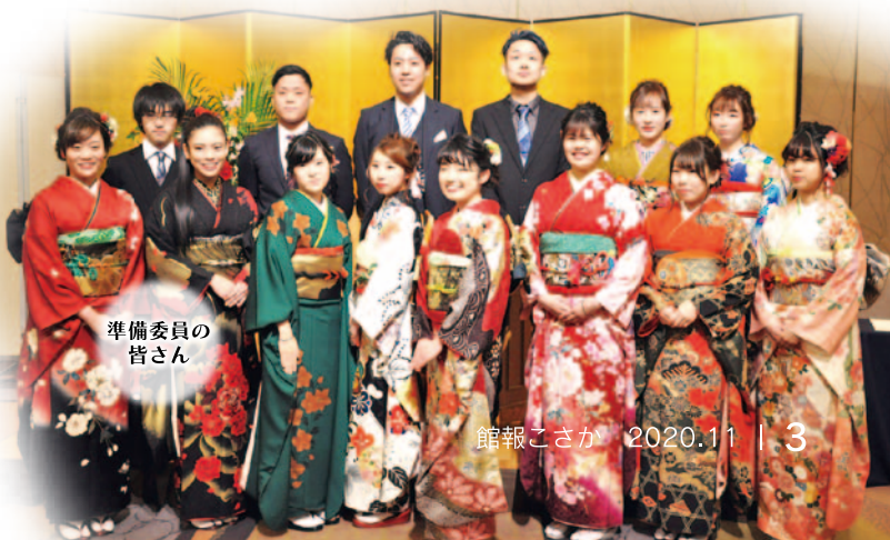
準備委員の皆さん

式典に続いて行われた懇親会では、懐かしい恩師、同級生と近況を語り合い、写真を撮影する姿も見られて賑やかに盛り上がっていました。